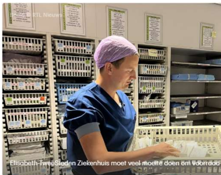
Elisabeth-TweeSteden Ziekenhuis moet veel moeite doen om voorraad op peil te houden

Door Koen de Regt & Roland Strijker 20 juli 2022 12:30 • Aangepast 20 juli 2022 15:48