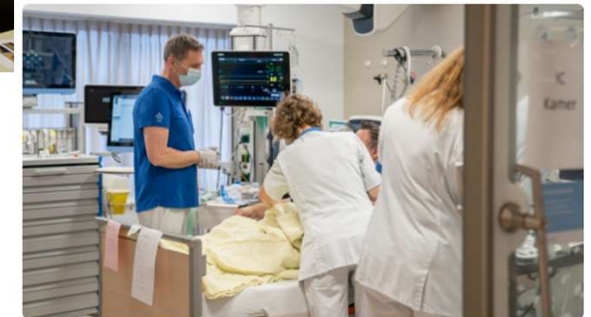
Drentse ziekenhuizen hebben materialentekort, operaties uitgesteld

25 juli 2022, 12:55 • 4 minuten leestijd