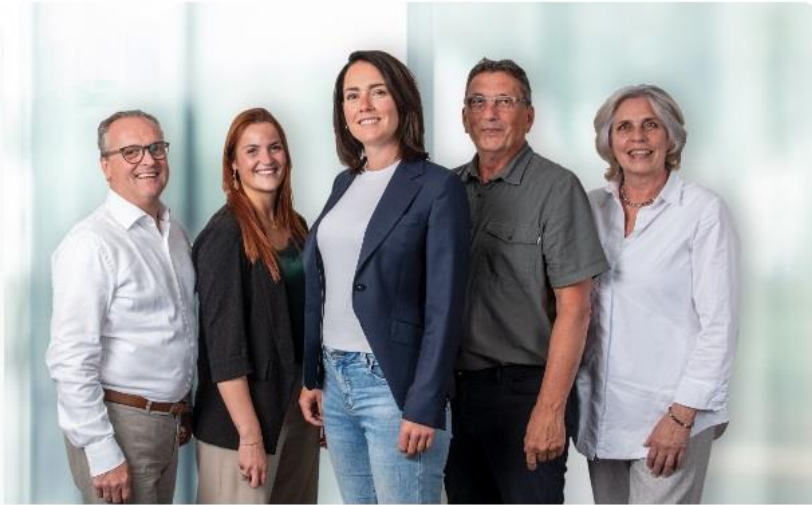
Meldpunt landelijke tekorten medische hulpmiddelen